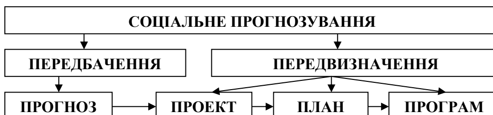
Рисунок 2. Системологія соціального прогнозування

Соціальне прогнозування (від грец. πρόγνωσις – перед знання) – це науково-аналітичне дослідження соціальної системи на фундаментальному рівні, який дає можливість передбачати, майбутнє, оскільки виступає як синтез різнобічних знань про суспільство. Виділяють кілька етапів соціального прогнозування: аналітичний, дослідний, програмний, організаційний (Рис. 2).