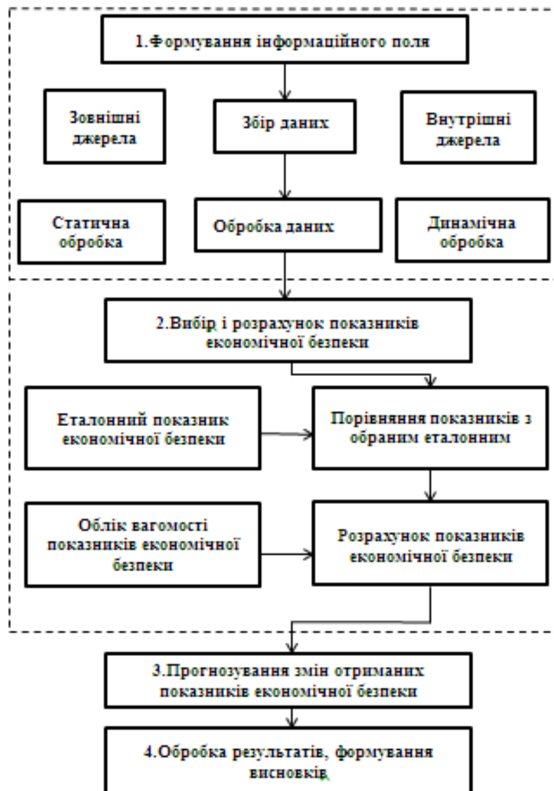
Рис. 1. Загальна схема побудови інтегральної моделі оцінювання

В якості основного інструменту досягнення цілей такого прогнозування пропонується проведення розрахунків техніко-економічних показників стану виробництва підприємства, що є основою оцінки економічної безпеки бізнесу. Для проведення розрахунків можуть бути використані спеціально розроблені моделі [4]. В якості варіанту пропонується загальна схема побудови інтегральної моделі оцінювання економічної безпеки підприємства, яка представлена на рис.1.