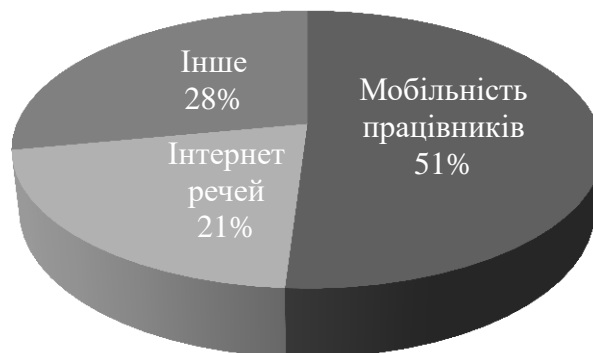
Рис. 3. Основні загрози інформаційної безпеки для організацій